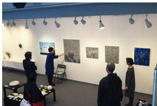
2018年12月 全労済ホール／スペース・ゼロ