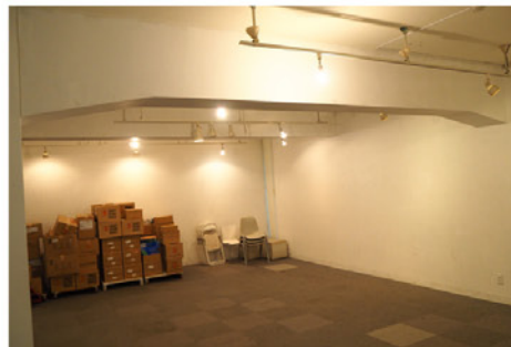
1F小部屋 (物販スペースの予定)