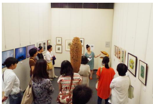
2014年9月 練馬区立美術館区民ギャラリー