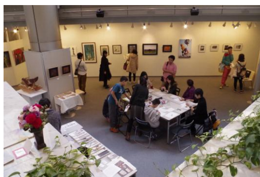
2016年11月 全労済ホール／スペース・ゼロ