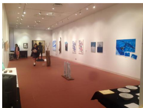
2015年11月 東京芸術劇場 アトリエウエスト